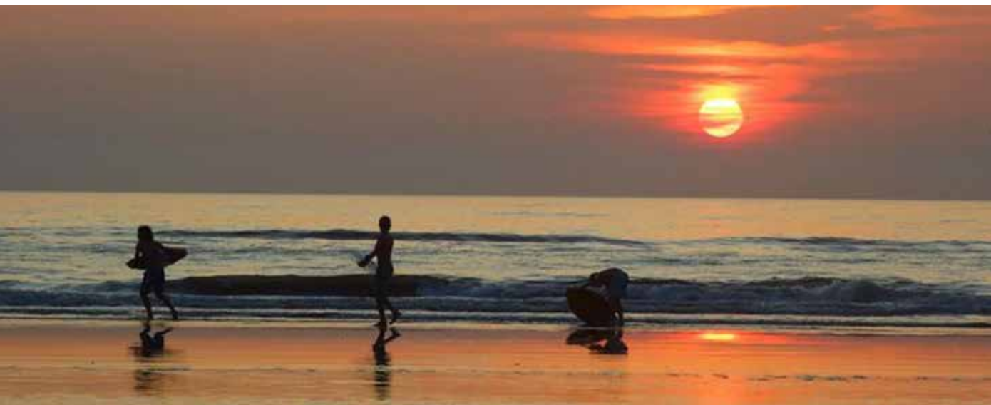
Fotograaf Rob Plasschaert